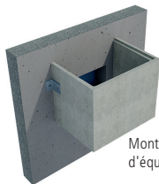
Montage direct avec 1 paire d'équerres de fixation

Extrait de la «Fiche de données du produit et instructions techniques de pose pour fixations de saut-de-loup». Consultable sous www.cbm-liste.ch .