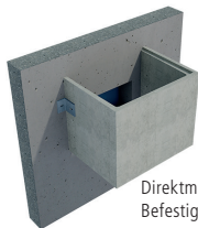
Direktmontage mit 1 Paar Befestigungswinkel

Auszug aus dem «Produkteblatt und technische Versetzanleitung für Lichtschachtbefestigungen» (abrufbar unter www.cbm-liste.ch ).