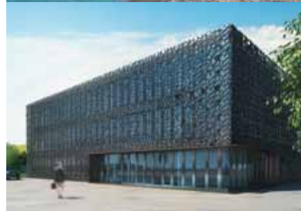
élément de façade VENA®