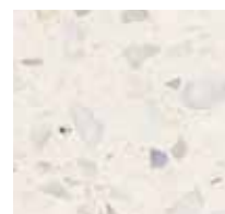
Carrare, 0-16 mm