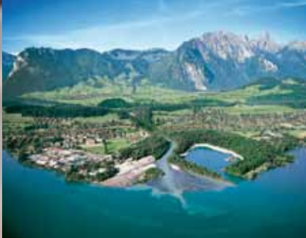
Usine de production à Einigen / BE