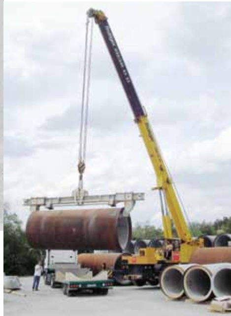
Tuyaux spéciaux avec enrobage en acier pour la galerie d'eau potable à Üetliberg