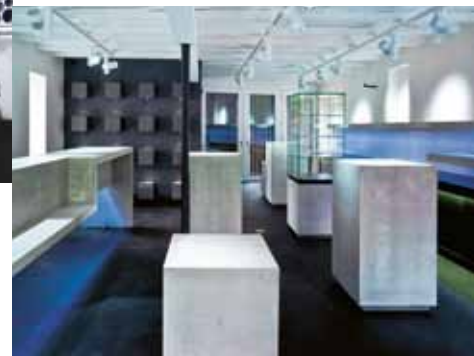
Meubles selon le voeu du client