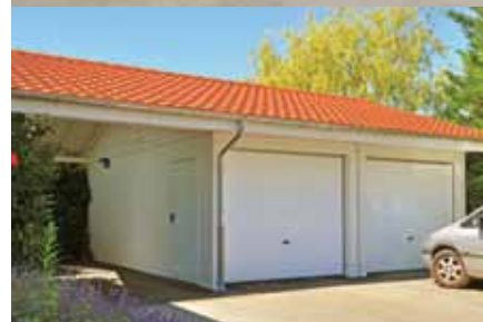
Garages à toit ou à deux pans