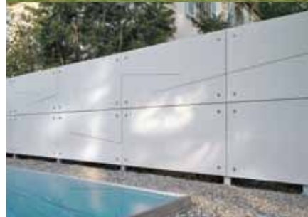
Paroi de séparation structurés