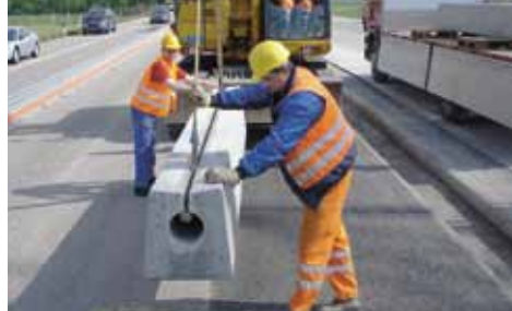
Cunettes pour poids lourds – assainisse- ment de l'autoroute A1