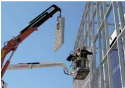
Montage des éléments

Avec la fourniture de nos produits en béton, nous proposons d'innombrables prestations de services précieuses. Des documents d'ordre pratique, tels que les informations sur les produits et les directives techniques forment la base de notre offre de services. Sur Internet, vous trouvez diverses aides de planification, des programmes de calcul et d'intéressantes nouveautés. Notre offre de prestations de services est enrichie par un déroulement des commandes professionnel, un service de livraison fiable directement sur le chantier accompagné d'une garantie d'usine.