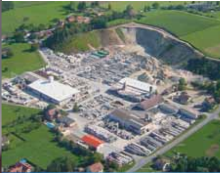
Usine de production à Granges-près- Marnand / VD