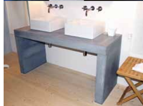
Table pour lavabos selon le souhait du client