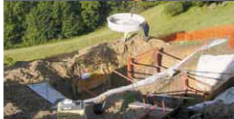
Assainissement des eaux usées de la commune de Brot-Dessous