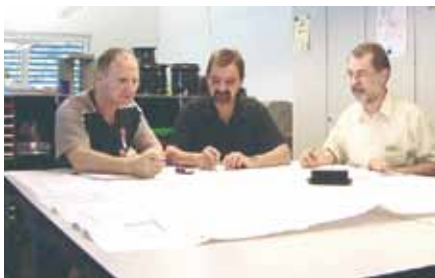
Séance de planification d'une adjudication

Du conseil au montage, en passant par la planification, conformément à vos souhaits, nous effectuons de A – Z tous les ordres relatifs à vos éléments spéciaux. Entre autres: