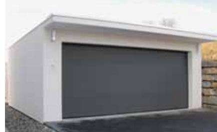
Garages indépendants avec portes sectionnelles et fenêtres