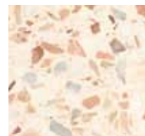
Marbella, 0-8 mm