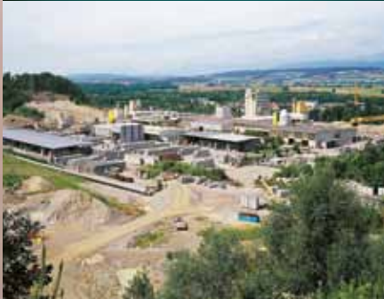
Usine de production à Lyss / BE