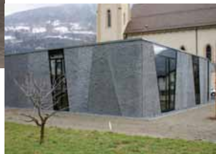
Eléments de façades structurés