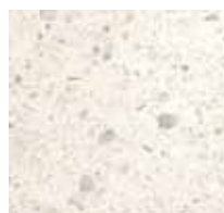
Carrare, 0-8 mm