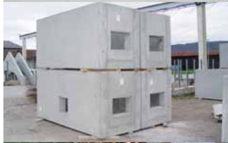
Chambres de tirage A1 Löwenberg – Gurbrü