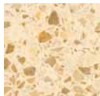
Jura, 0-8 mm