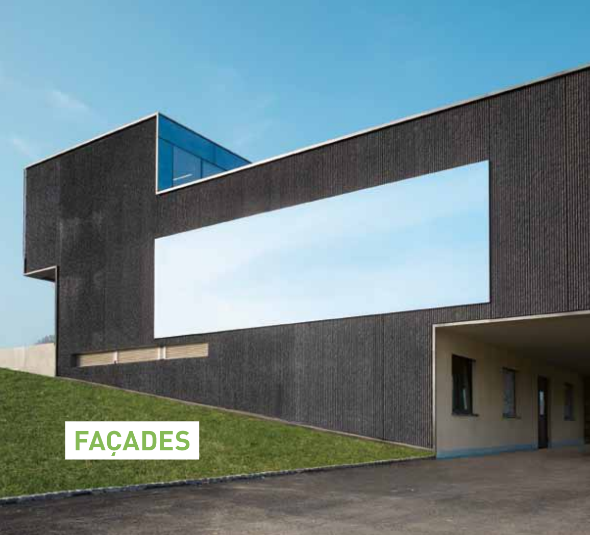
Eléments en béton avec structure nervurée