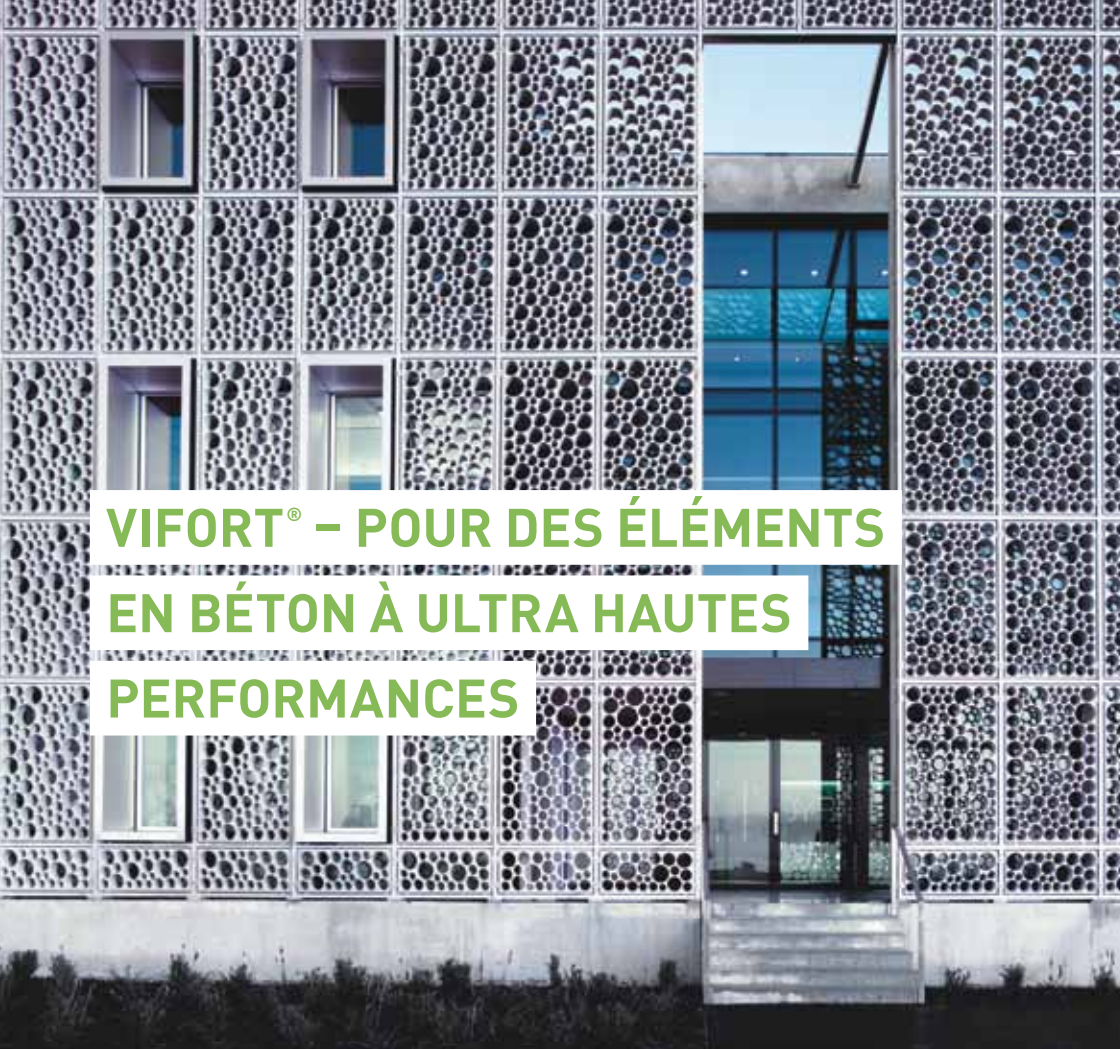
Eléments de façades préfabriqués en béton d'une extrême finesse pour «Dress Your Body SA» du Swatch Group