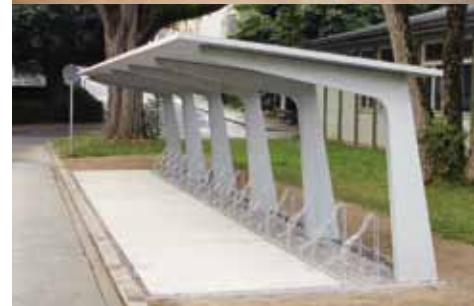
Abri pour vélos avec construction filigranée en béton VIFORT®