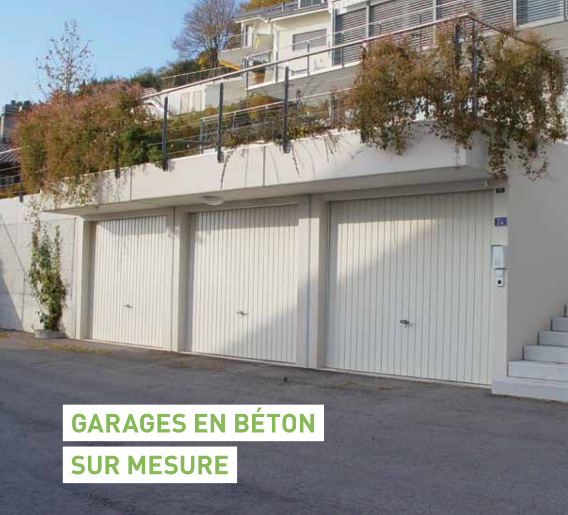
Garages partiellement enterrés avec porte basculante et terrasse garnie de plantes